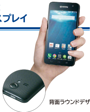
背面ラウンドデザイン

幅64mmの背面ラウンド形状で、手の小さな女性でも持ちやすいコンパクトデザイン。ディスプレイは、ボディいっぱいに広がる約4.5インチqHDなので、地図やWeb、メールの文字も大きくはっきり見えます。