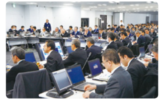
全国の総支社を通信機器で結んで行われた災害対策訓練

また、「新型インフルエンザ対策ガイドライン」(2009年2月新型インフルエンザおよび鳥インフルエンザに関する関係者対策会議)に基づき、新型インフルエンザの大流行時においても、お客さまに情報通信サービスを継続してご提供するために、社員の健康にも万全を期し、的確な対応を図るための「新型インフルエンザ発生時の全社事業継続計画」を策定しています。