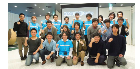
第6期「KDDI ∞ Labo」参加メンバー Participants in the sixth-phase “KDDI ∞ Labo” program