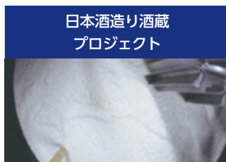
日本酒造り酒蔵プロジェクト