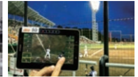
自由視点 スタジアム観戦