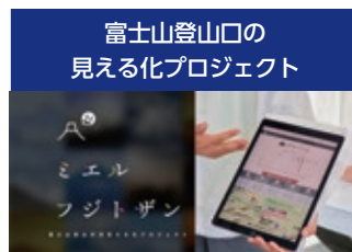
富士山登山口の見える化プロジェクト