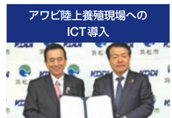
アワビ陸上養殖現場へのICT導入