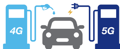
ハイブリッドネットワーク

KDDIは2019年4月に5G周波数の割り当てを受けました。2019年9月から一部でトライアルを開始し、2020年3月末までに5G対応の端末を発売する予定です。5Gエリアの拡大期には、既存の強靱な4Gネットワークを組み合わせたハイブリッドネットワークで、高速・高品質なサービスを提供していきます。