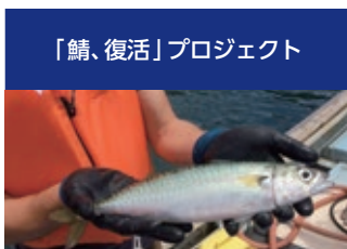
「鯖、復活」プロジェクト